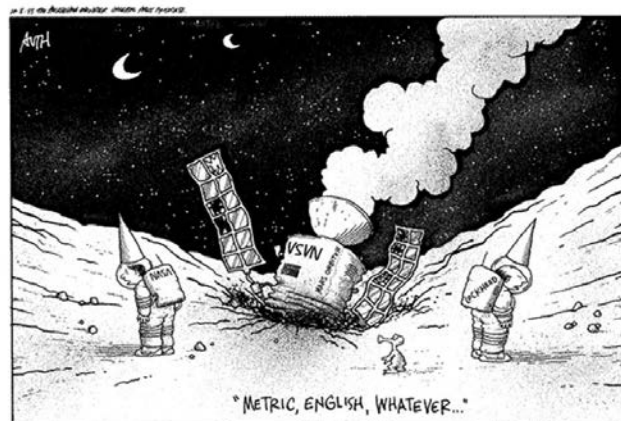
Remember the Mars Climate Orbiter incident from 1999?

Eine wissenschaftliche Katastrophe war allerdings 1999 der Absturz des Mars Climate Orbiters, einer Nasa Sonde. Wegen unterschiedlicher Maßeinheiten kam es zu Umrechnungsfehlern. Die Sonde näherte sich deswegen einen Huodsfozt zu sehr dem Mars und stürzte ab.